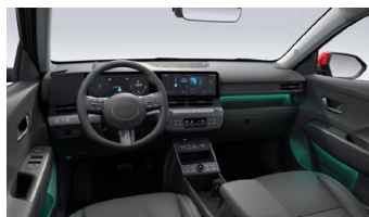
Černý interiér – čalounění sedadel kůže – výhradně pro Style Premium