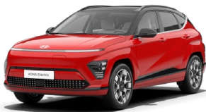
Engine Red Pastelová Kombinace s černým lakováním střechy Cena: 0 Kč