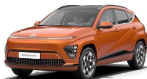
Jupiter Orange Metalická Kombinace s černým lakováním střechy Cena: 17 900 Kč