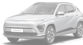
Shadow Grey Speciální pastelová Kombinace s černým lakováním střechy Cena: 17 900 Kč Pouze pro N Line