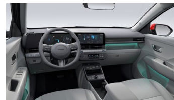
Šedý interiér – čalounění sedadel kůže – výhradně pro Style Premium