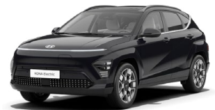
Abbys Black Pearl Perleťová Cena: 17 900 Kč