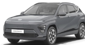
Ecotronic Gray Perleťová Kombinace s černým lakováním střechy Cena: 17 900 Kč