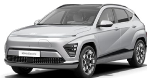
Shimmering Silver Metalická Kombinace s černým lakováním střechy Cena: 17 900 Kč