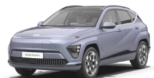
Meta Blue Pearl Metalická Kombinace s černým lakováním střechy Cena: 13 900 Kč