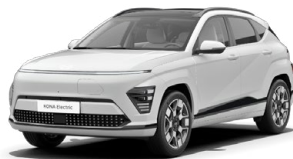
Atlas White Speciální pastelová Kombinace s černým lakováním střechy Cena: 10 000 Kč