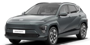
Cypress Green Perleťová Kombinace s černým lakováním střechy Cena: 17 900 Kč