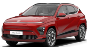
Ultimate Red Metalická Kombinace s černým lakováním střechy Cena: 17 900 Kč