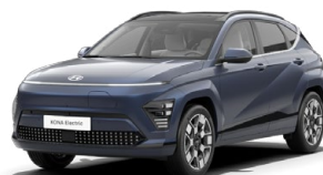
Sailing Blue Perleťová Kombinace s černým lakováním střechy Cena: 17 900 Kč