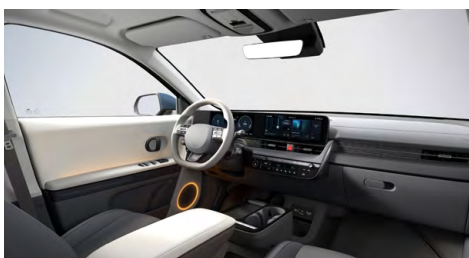
Šedý interiér – čalounění sedadel kůže-látka – dostupné pro Style na přání