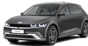
Ecotronic Gray Matná metalická Cena: 24 900 Kč