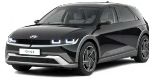
Abbyss Black Pearl Perleťová Cena: 19 900 Kč