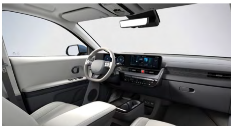
Šedý interiér – kožené čalounění sedadel – výhradně pro Style Premium