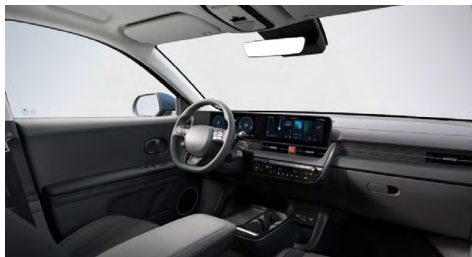
Černý interiér – látkové čalounění sedadel – dostupné pro Smart, Style