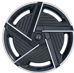
20" kola z lehké slitiny