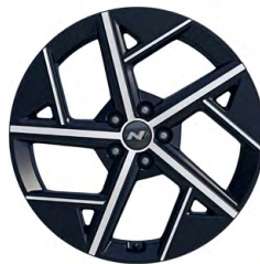
20" kola z lehké slitiny N Line

www.porovnejhyundai.cz (Porovnejte si vozy Hyundai s konkurencí)