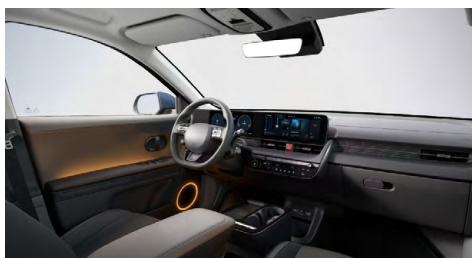
Černý interiér – čalounění sedadel kůže-látka – dostupné pro Style na přání