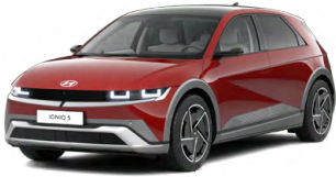
Ultimate Red Metalická Cena: 0 Kč