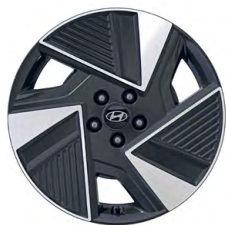
19" kola z lehké slitiny