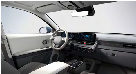
Šedý interiér – látkové čalounění sedadel – dostupné pro Smart, Style