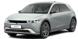
Celadon Gray Matná metalická Cena: 24 900 Kč Nelze pro N Line Dostupné později