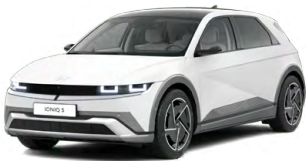
Atlas White Matná metalická Cena: 24 900 Kč