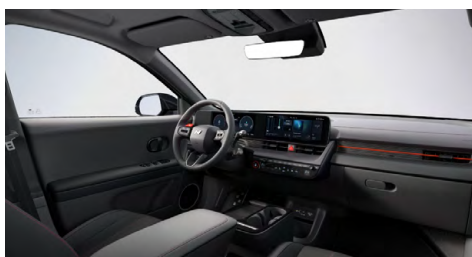
N Line interiér – čalounění sedadel kůže-látka – výhradně pro N Line Style