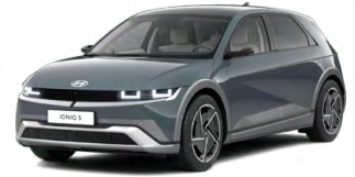
Digital Teal-Green Perleťová Cena: 19 900 Kč Nelze pro N Line