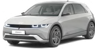
Cyber Gray Metalická Cena: 19 900 Kč