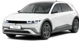
Atlas White Speciální pastelová Cena: 11 900 Kč