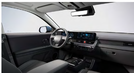
Černý interiér – kožené čalounění sedadel – výhradně pro Style Premium