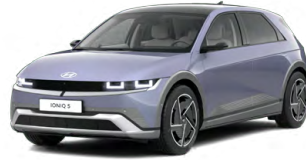
Meta Blue Metalická Cena: 19 900 Kč Nelze pro N Line