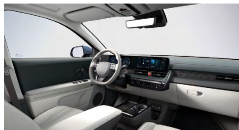
Šedo zelený interiér – kožené čalounění sedadel – výhradně pro Style Premium